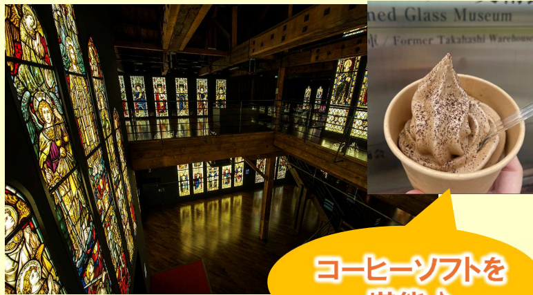
※ステンドグラス美術館 イメージ