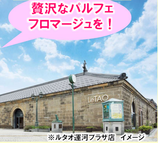
※ルタオ運河プラザ店 イメージ